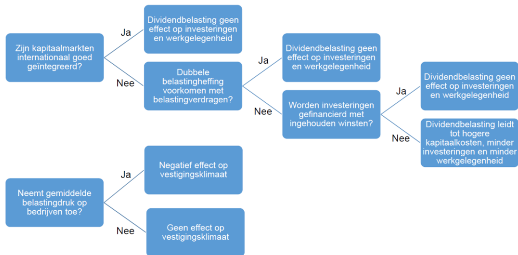
Figuur 2 Wanneer leidt de dividendbelasting tot economische effecten?

Stel nu dat lokale financieringscondities wel van belang zouden zijn voor Nederlandse bedrijven, omdat kapitaalmarkten niet perfect zijn geïntegreerd. De tweede cruciale deelvraag is dan: wordt dubbele belastingheffing op dividend van buitenlandse ondernemingen in Nederland voorkomen? Dat is waarschijnlijk. Voor de Nederlandse aandeelhouder maakt het niets uit, want die kan de dividendbelasting verrekenen. Het omvangrijke Nederlandse netwerk van belastingverdragen poogt dubbele belastingheffing te voorkomen bij buitenlandse aandeelhouders. Als dubbele belastingheffing adequaat wordt voorkomen, dan is de verlaging van de dividendbelasting in Nederland slechts het spekken van buitenlandse aandeelhouders of overheden. Voor bedrijven geldt bovendien vrijwel altijd dat dividenduitkeringen zijn vrijgesteld van belastingheffing via de deelnemingsvrijstelling.